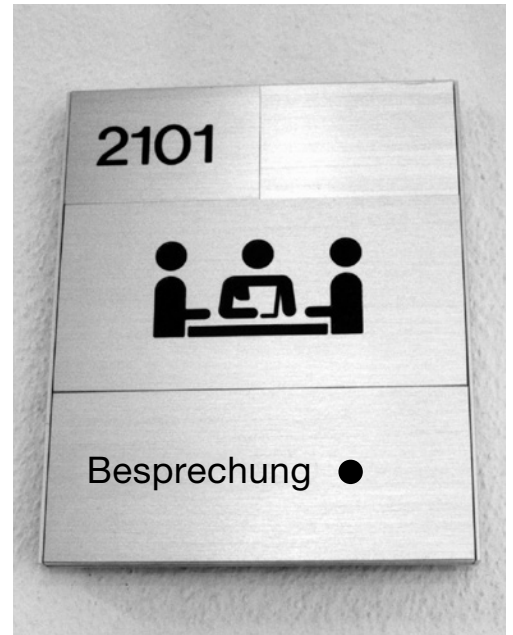
3 Offene Kommunikation ist eine wichtige Voraussetzung für das Vermeiden von Stress.

Ergänzende Informationen zum Thema finden Sie auf www.suva.ch unter dem Stichwort «Stress».