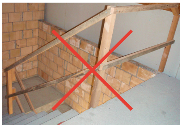
2 Dachlatten als Seitenschutzbauteile (hier im Treppenhaus) sind verboten.