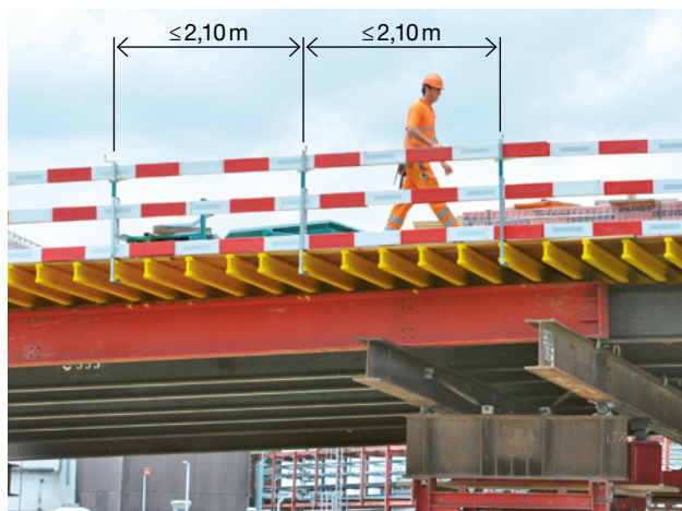
1 Seitenschutz mit rot-weissen Absperrlatten: maximaler Pfostenabstand 2,10 m

Keine Abschnitte von Schalttafeln als Seitenschutzbauteile verwenden! Seitenschutz mit Absperrlatten: Pfostenabstand \leq 2,10 m