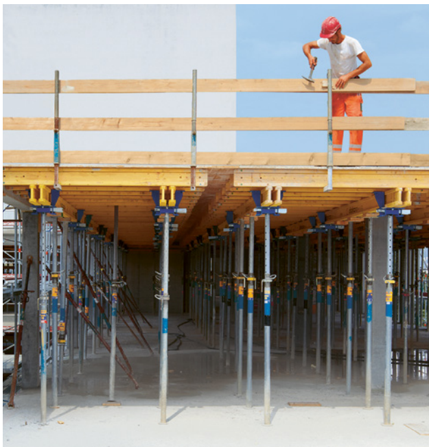
3 Seitenschutz mit Schutzgeländerzwingen