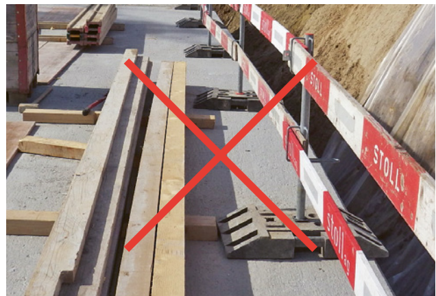
6 Gummisockel für den Seitenschutz an Deckenkanten sind verboten, weil der Seitenschutz leicht kippen kann.