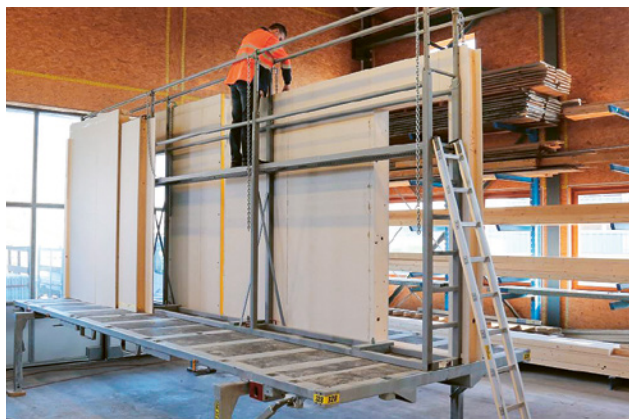
3 Piattaforma scarrabile con passerella integrata

L'utilizzo di passerelle integrate consente di caricare e scaricare in tutta sicurezza i prefabbricati in legno in officina e nel cantiere. Il personale raggiunge i dispositivi di fissaggio e di imbracatura da una posizione sicura e può agganciare i prefabbricati in legno alla gru. Le passerelle sono indicate soprattutto per il trasporto di prefabbricati posti in verticale.