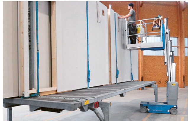
1 Messa in sicurezza dei prefabbricati tramite dispositivi di fissaggio

L'ancoraggio per il trasporto può essere montato preventivamente in officina, deve soddisfare le prescrizioni dell'azienda di trasporto e viene garantito ad es. da un sistema twistlock.