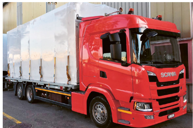
2 Messa in sicurezza della piattaforma scarrabile con il sistema twistlock. I prefabbricati durante il trasporto sono protetti contro gli agenti atmosferici da una pellicola bianca.

Utilizzare solamente dispositivi di ancoraggio certificati e omologati. La messa in sicurezza dei prefabbricati deve essere tale da poter resistere ai movimenti causati dagli ancoraggi e dal trasporto.