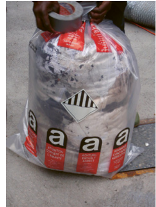
4 Kunststoffsack mit der Kennzeichnung Asbest