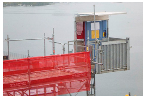
4 Accesso sicuro alla piattaforma di un montacarichi da cantiere