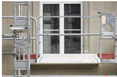
1 Punto di carico/scarico con dispositivo di bloccaggio della porta

Non viene lasciato del materiale in giro, tutti i punti con pericolo di caduta sono stati messi in sicurezza, ecc. (Fig. 4)