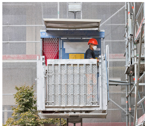
3 Piattaforma con tetto di protezione