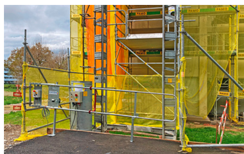
2 Recinzione attorno alla base