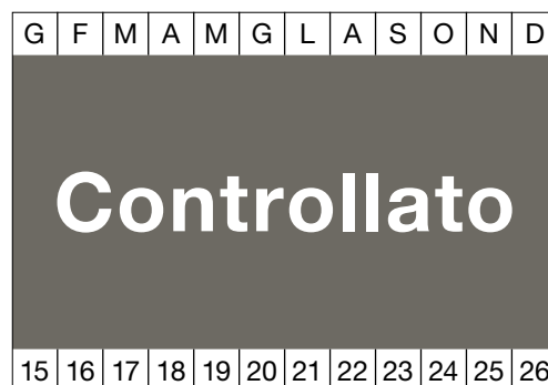
7 Etichetta adesiva con la data del successivo intervento di manutenzione

È possibile che nella vostra azienda esistano altre fonti di pericolo su questo argomento. In tal caso, occorre adottare i necessari provvedimenti e annotarli sull'ultima pagina.