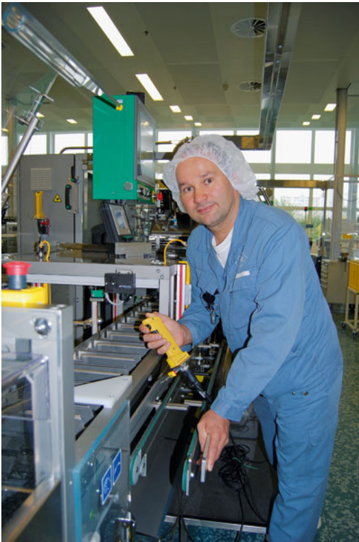
Lors du fonctionnement en service particulier, l'employé fait fonctionner la machine au moyen d'une commande de validation et d'un bouton poussoir.