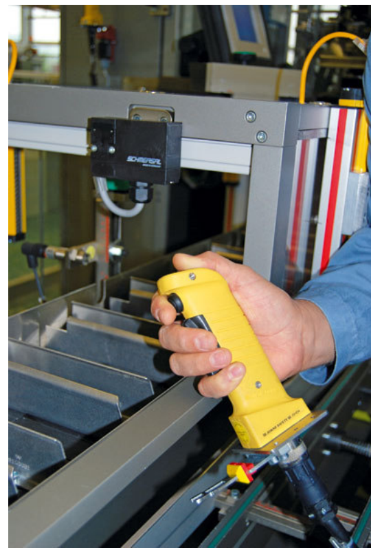
La cartonreuse est équipée d'une commande de validation portable à 3 positions d'action.