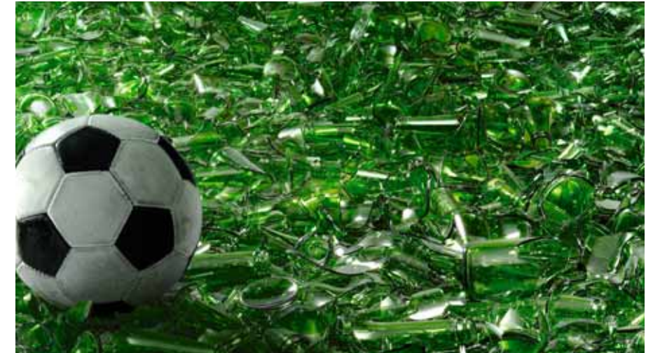
01 // La Suva ha introdotto nuove misure di prevenzione contro il consumo di alcol durante i tornei di calcetto.

Alla fine degli anni '90 sui campi di calcio si registravano ogni anno circa 38 000