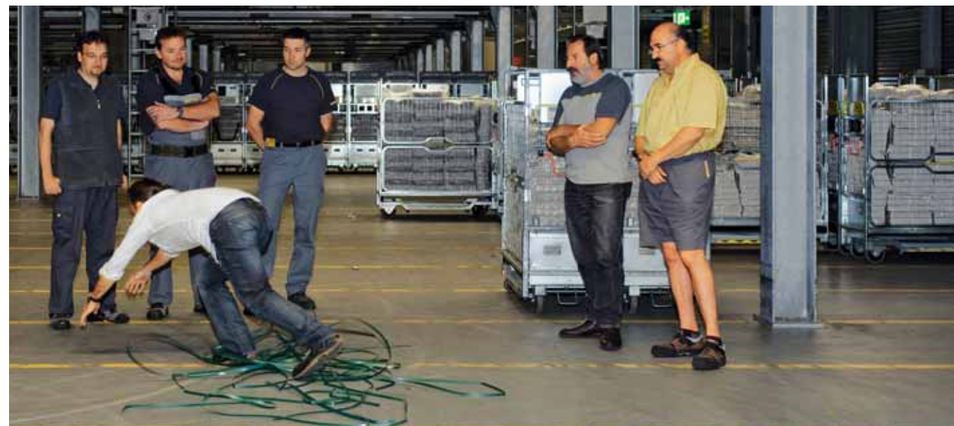
01 // Le trappole sul pavimento sono spesso molto vicine. Tutti i dipendenti di PostLogistics vengono sensibilizzati nei confronti di questo problema.

Per i postini il rischio di cadere, inciampare o scivolare è molto elevato. Prendendo spunto dalla campagna Suva «inciampare.ch», PostLogistics ha organizzato alcuni workshop per sensibilizzare oltre 5700 dipendenti nei confronti di questi rischi.