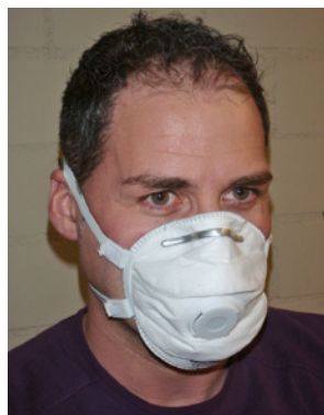
2 Masque à usage unique FFP3.