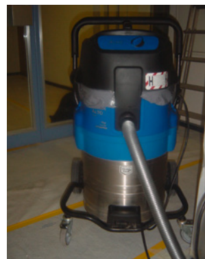
3 Aspirateur industriel de classe H (amiante).