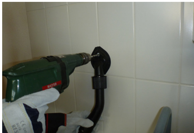
4 Perceuse avec aspiration à la source pour les carreaux en céramique comportant de la colle amiantée.