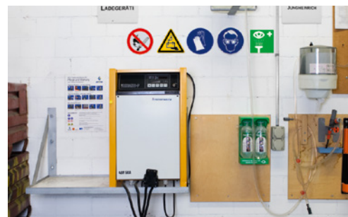
5 Vorschriftsgemäss ausgerüstete Batterieladestation mit Rauchverbot. Schutzbrille und Augendusche sind vorhanden.