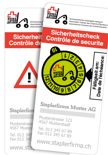
4 Vignette als Nachweis für die Instandhaltung.