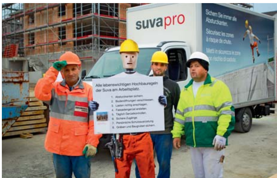
01 // La sagoma in cartone di «Risky» ha avuto una forte visibilità lo scorso anno.

Il testimonial «Risky» si rimette in viaggio per fare tappa in diversi cantieri svizzeri. La sua missione è sensibilizzare i lavoratori sul posto di lavoro e ricordare loro quali sono le «regole vitali» per la loro sicurezza.