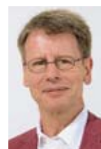
////// Jacques Poget , cronista, ex capo redattore di 24 heures e presidente della giuria del Prix Suva des Médias.