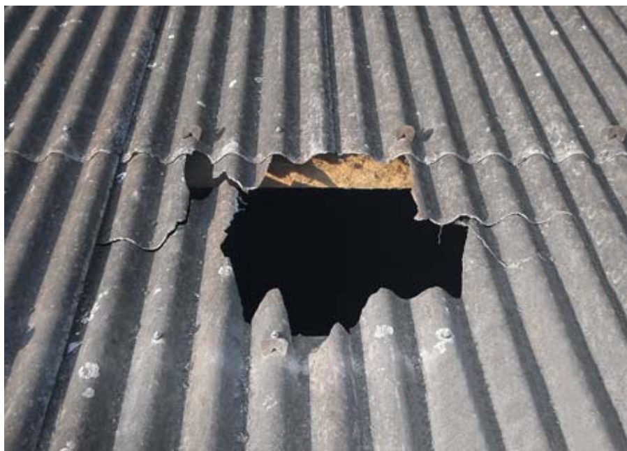
01 // L'operaio ha sfondato questo tetto in fibrocemento e ha subito gravissime lesioni.

Due operai impegnati sul tetto di un fienile in fibrocemento sfondano una lastra di copertura. Uno dei due cade nel vuoto da un'altezza di 6,5 m e riporta gravissime lesioni.