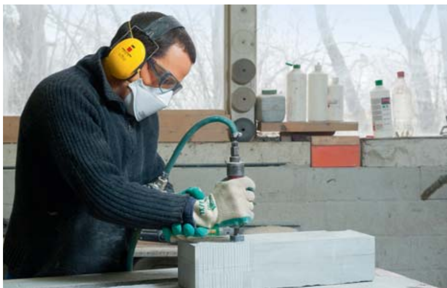
01 // Utilizzare apparecchi vibranti può mettere a rischio la salute. Le nuove pubblicazioni della Suva spiegano come proteggersi. // Dominik Wunderli