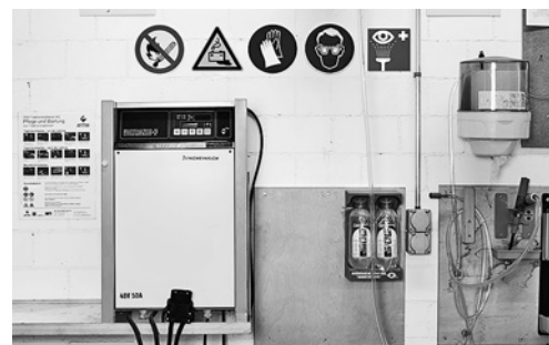
5 Stazione di caricabatterie a norma, segnaletica di sicurezza, doccia oculare, occhiali di protezione chiusi e guanti resistenti agli acidi