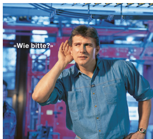
5 Hörprobleme können die Folge von zu lautem Musikkonsum sein.

Es ist möglich, dass in Ihrem Betrieb noch weitere Gefahren zum Thema dieser Checkliste bestehen. Ist dies der Fall, treffen Sie die notwendigen zusätzlichen Massnahmen. Notieren Sie diese auf der letzten Seite.