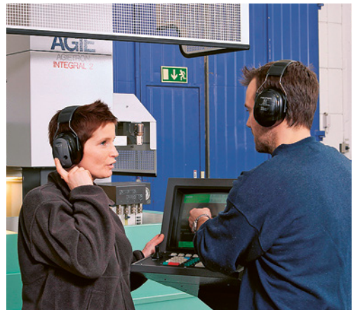
1 Auch bei Musik sollte Kommunikation immer möglich sein.

Mit dem Beantworten der folgenden Fragen können Sie abklären, ob durch das Musikhören am Arbeitsplatz das Gehör geschädigt wird.