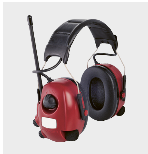
3 Gehörschutzkapseln mit eingebautem Radio