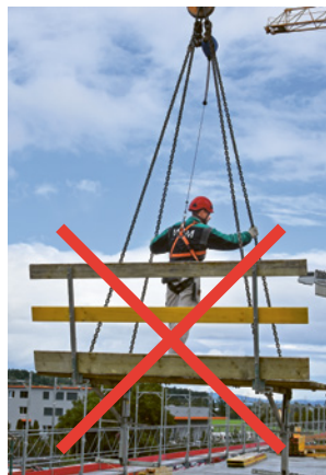
2 Le transport de personnes encordées au crochet de la grue est également interdit.