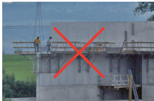
3 Ne jamais travailler sans protection contre les chutes.

Le transport de personnes avec des grues est interdit pour la réalisation de murs en béton de grande hauteur!