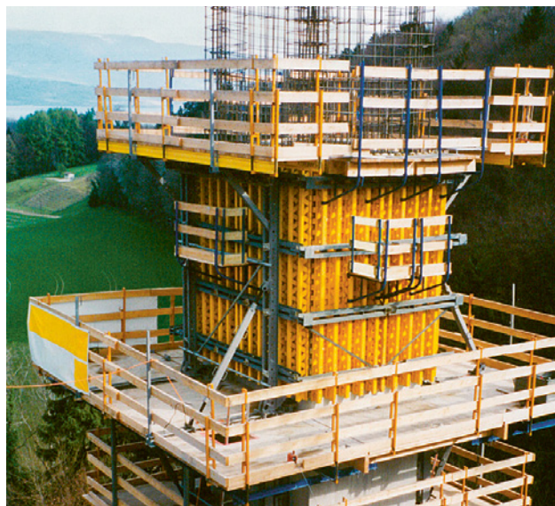
6 Travailler en toute sécurité avec un système de coffrage grim pant équipé d'une plateforme suiveuse.