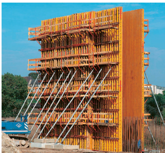
4 Élément pour panneaux de murs de grande hauteur.