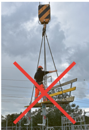
1 Interdiction de transporter des personnes sur une plateforme de bétonnage.