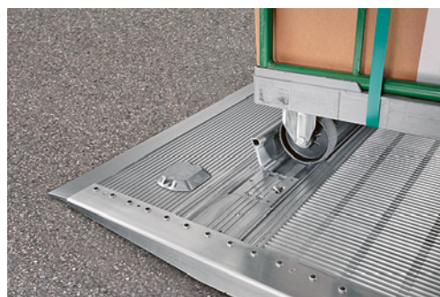
4 Sponda caricatrice con dispositivo fermaroll