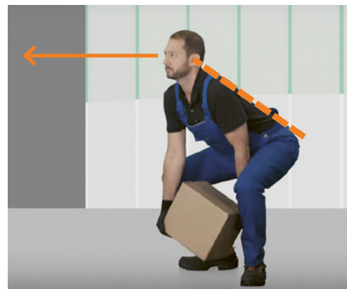
6 Tecnica corretta: sollevare il carico con la schiena dritta e senza movimenti bruschi.