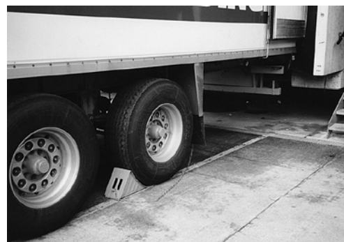
5 Veicolo bloccato con un cuneo

Guanti di protezione, scarpe di sicurezza, gilet di segnalazione, indumenti adatti contro gli spifferi, per il passaggio da zone calde a fredde, un cambio per gli indumenti bagnati di sudore.