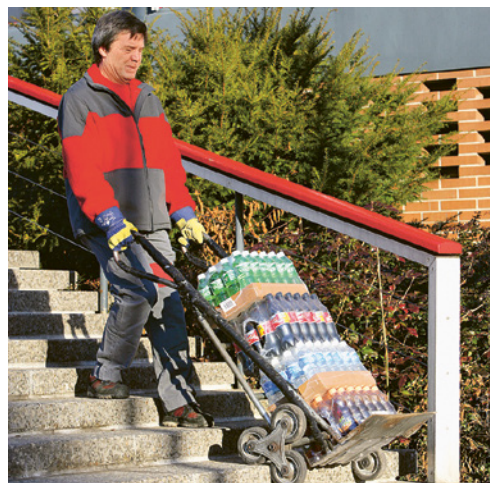
1 Usare attrezzature appropriate per il trasporto dei carichi.