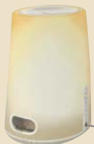
2° premio: lampada-sveglia