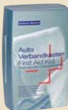
Dal 4° al 10° premio: cassetta di pronto soccorso

❖ Termine di partecipazione: 13 settembre 2013