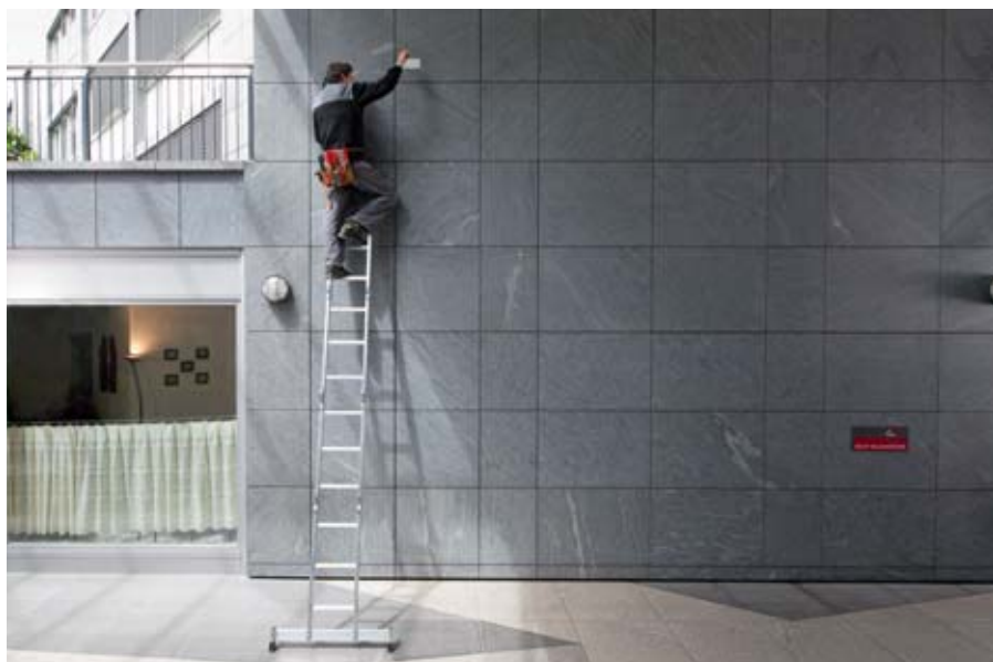
La scala su cui si trovava l'apprendista era troppo corta (scena ricostruita).

Un apprendista impiegato in un'azienda di installazioni elettriche finisce a terra da un'altezza di 3 metri in seguito al ribaltamento della scala. Nella caduta riporta una contusione al torace e si rompe un polso.