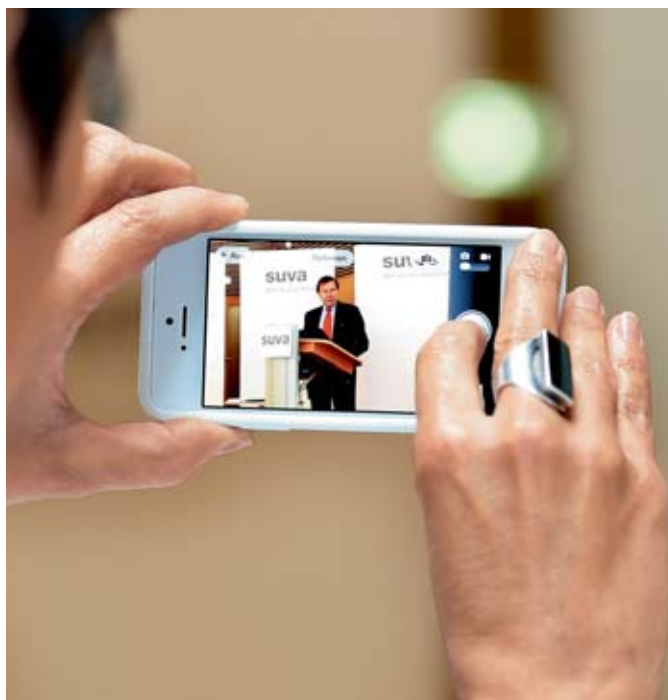
Il presidente del Consiglio di amministrazione nel mirino.