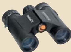
3° premio: binocolo