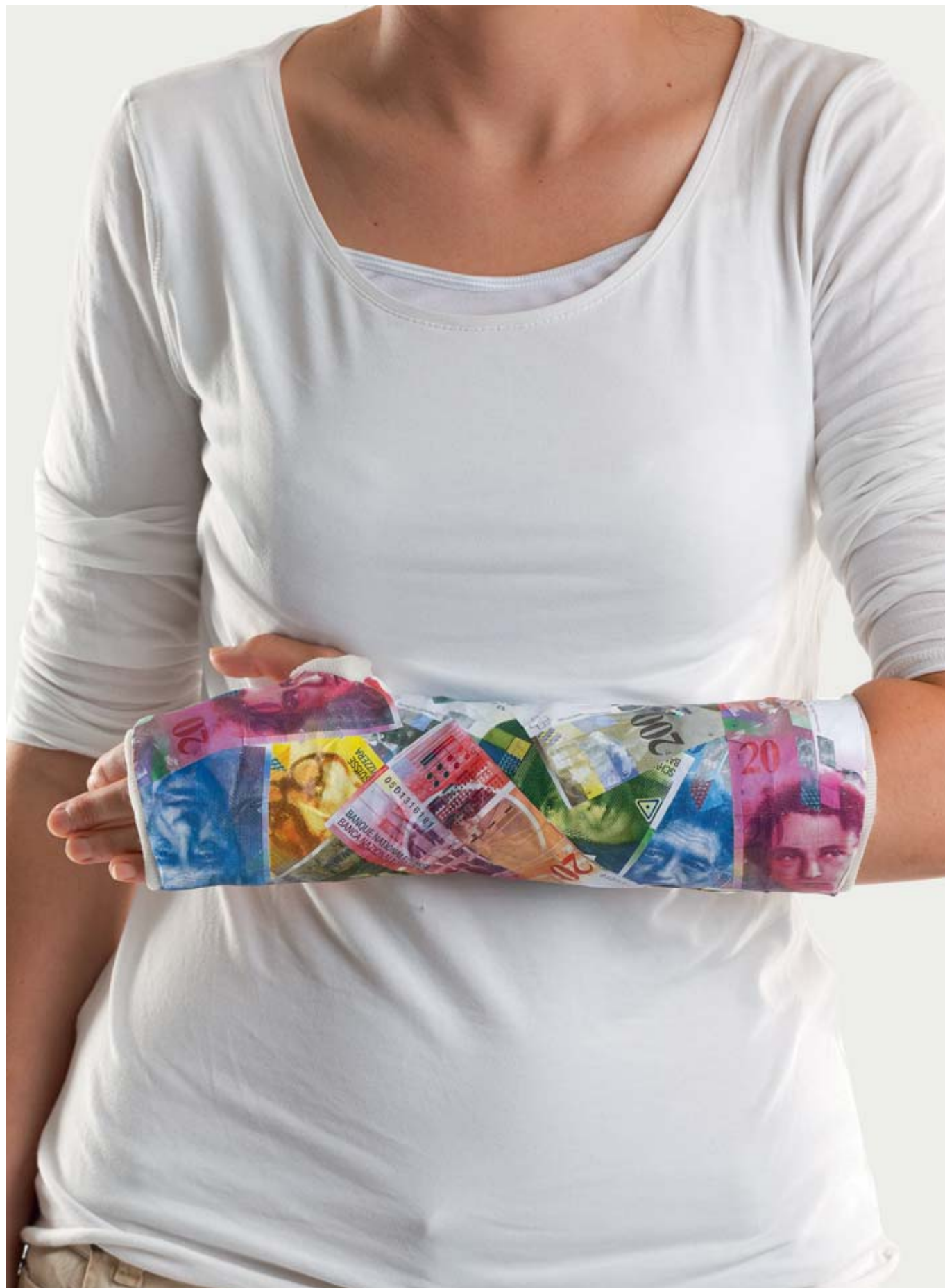
Settima riduzione consecutiva dei premi in molti settori a partire da gennaio 2014.