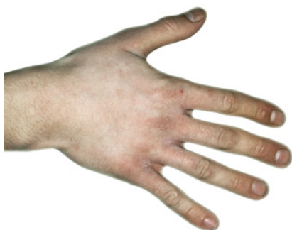
Début d'une irritation de la peau

Un soin régulier des mains leur donne un bel aspect.