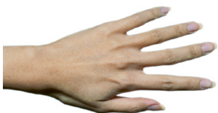
Main bien soignée