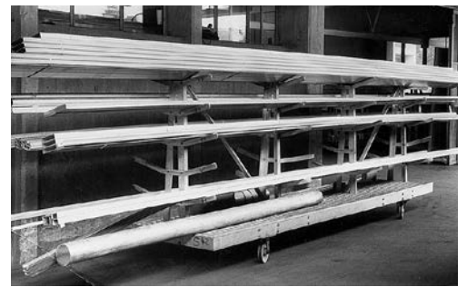
5 Barres entreposées horizontalement sur un chariot spécial