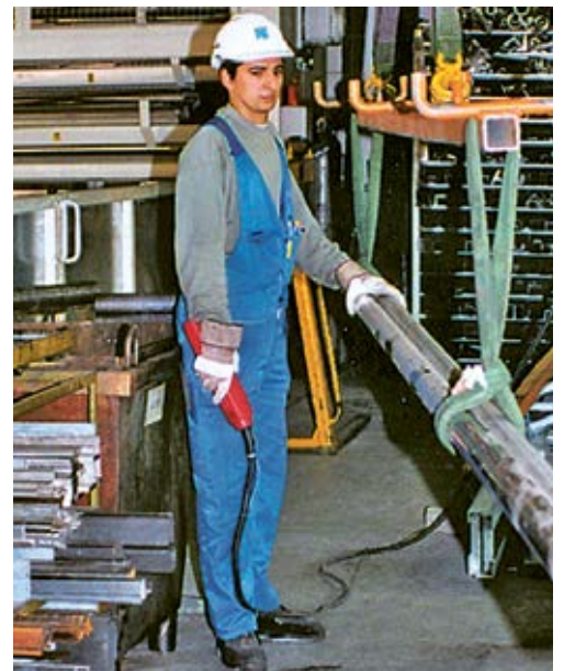
7 Des équipements de protection individuelle (gants, chaussures, casque) et des accessoires adaptés réduisent le risque d'accident.

Si vous avez constaté d'autres dangers concernant ce thème dans votre entreprise, notez également au verso les mesures qui s'imposent.