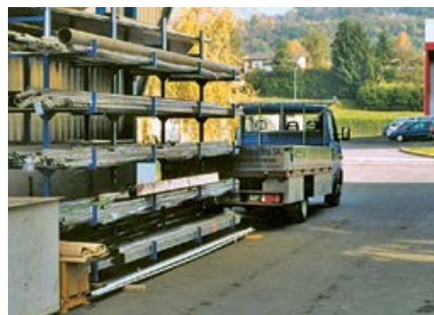
1 Zone de réception des marchandises équipée d'une étagère pour l'entreposage provisoire des barres