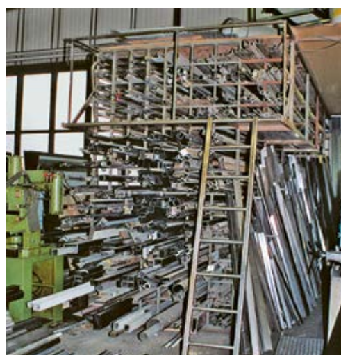
4 Profilés entreposés horizontalement sur une étagère haute avec une plateforme d'accès