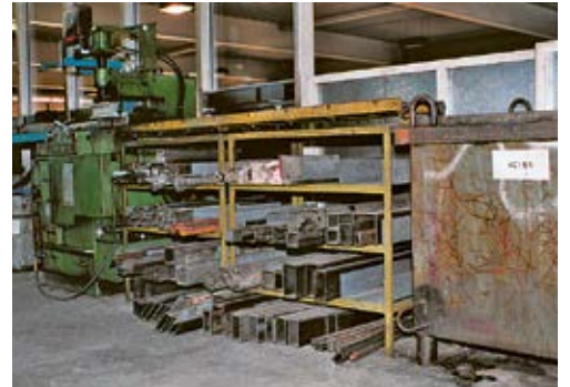
6 Les chutes des barres et des profilés sont stockées à proximité immédiate de la scie.