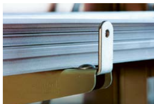
3 Cornière de retenue