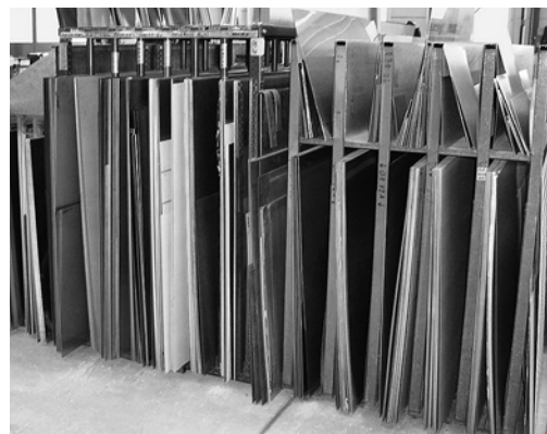
1 Lamiere stoccate in modo sicuro e visibile