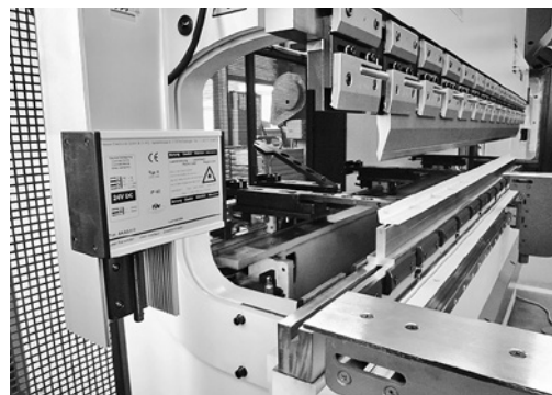
3 Dispositivo di protezione ottico sulla lama superiore.