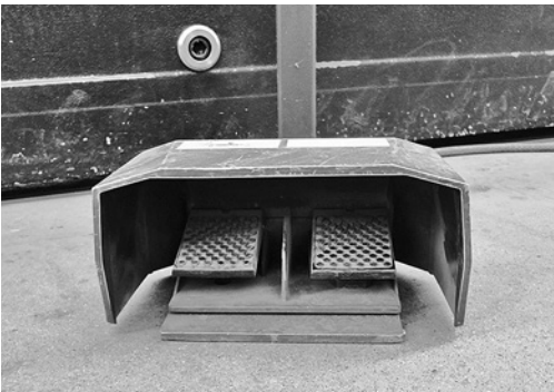
5 La calotta di protezione del comando a pedale impedisce l'avvio accidentale della macchina.