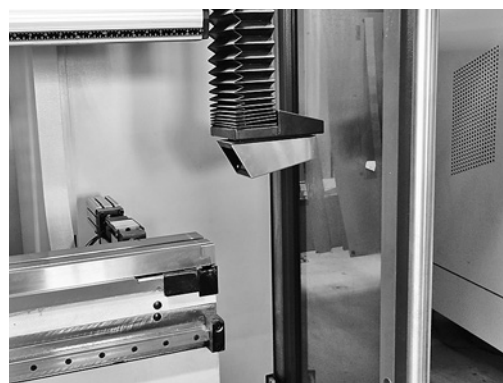
4 Dispositivo di protezione ottico e porte di protezione laterali; è vietato sostare tra le porte di protezione e l'utensile.