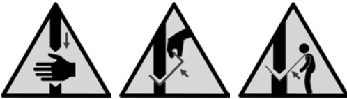
9 Rischi residui connessi alla pressa piegatrice Sinistra: schiacciamento di dita, mani e braccia tra punzone e stampo di piegatura Centro: schiacciamento delle dita tra pezzo e lama superiore (vedi fig. 8 per la posizione corretta) Destra: impatto da movimenti oscillatori di grossi pezzi

Ulteriori informazioni • SN EN 12622 Sicurezza delle macchine utensili – Presse piegatrici idrauliche