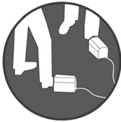
6 Per ogni operatore di una pressa piegatrice deve essere presente e funzionante un interruttore di sicurezza a pedale.