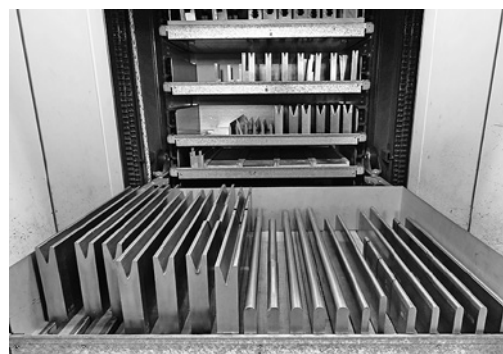
2 Stoccaggio ordinato degli utensili in prossimità della pressa piegatrice