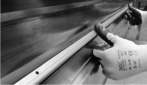
8 Mani in posizione corretta per la seconda fase di piegatura