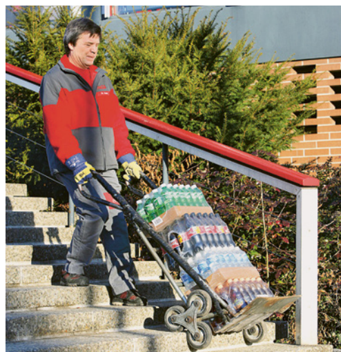
3 Utilizzare degli ausili, ad esempio un pratico carrello saliscala.

È possibile che nella vostra azienda esistano altre fonti di pericolo su questo argomento. In tal caso, occorre adottare i necessari provvedimenti e annotarli sull'ultima pagina.