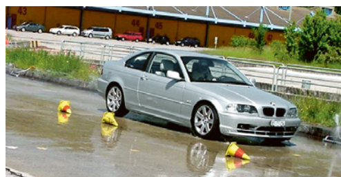
5 Durante i corsi di guida sicura i collaboratori imparano ad affrontare diverse situazioni difficili nella circolazione stradale.