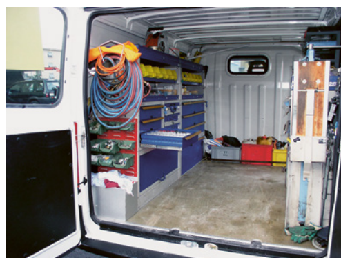
4 Fissaggio del carico all'interno del veicolo