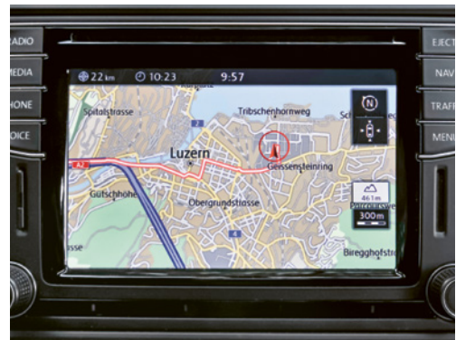
2 Con un apparecchio di navigazione è possibile raggiungere direttamente il cliente senza dover effettuare ricerche.