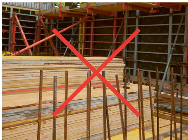
1 Ferri di ripresa non messi in sicurezza

L'imprenditore deve esigere dall'ingegnere progettista che i ferri di ripresa siano sagomati a gancio o a staffa.