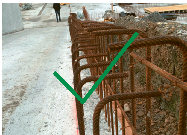
2 Ferri di ripresa a staffa