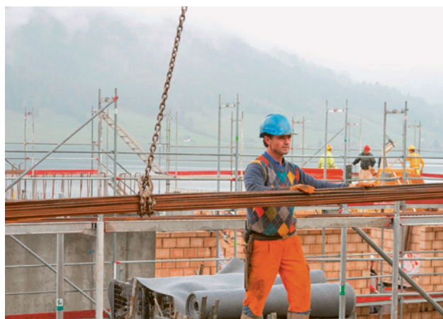
4 Trasporto di un fascio di ferri di armatura con gru