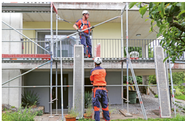
4 Montaggio con DPI anticaduta