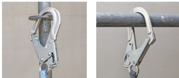
5 e 6 I moschettoni specifici per impalcature possono essere usati solo verticalmente e senza sollecitazione trasversale.