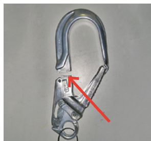
7 I moschettoni sollecitati trasversalmente possono portare alla rottura con conseguente caduta dall'alto.