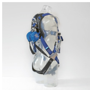
2 Set di DPI anticaduta per l'installazione dei ponteggi di facciata: imbracatura, due dispositivi retrattili da 2,5 m con doppio girevole e moschettone specifico per impalcature (EN 362 + ANSI Z359.12).