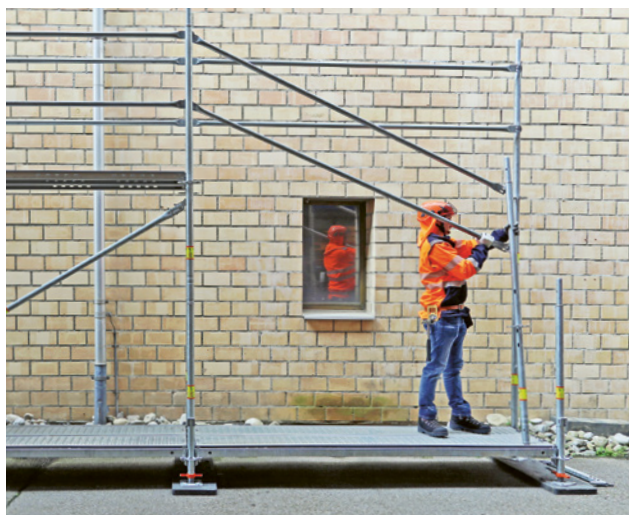
1 Montaggio del sistema di protezione laterale dal livello inferiore – parapetto legato al sistema durante le fasi di montaggio, utilizzo e smontaggio.

Diversi fabbricanti di ponteggi offrono soluzioni che proteggono collettivamente i lavoratori durante il montaggio. Tuttavia, alcune di esse sono svantaggiose sotto il profilo ergonomico.