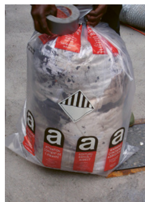
4 Sacco di plastica con la dicitura «Amianto»