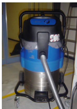
3 Aspiratore industriale con filtro di classe H (amianto)