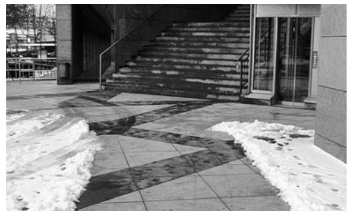
2 Voie de circulation dépourvue de neige et de glace.