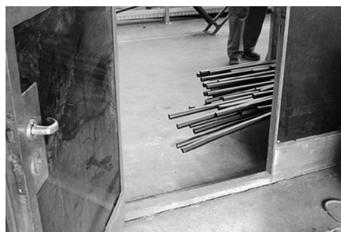
7 Attention, risque de chute! Pensez à vos collègues!