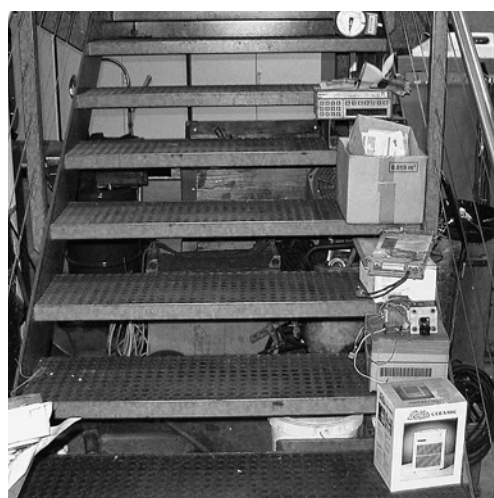
8 Tout objet déposé sur une marche d'escalier constitue un risque de chute.

Si vous avez constaté d'autres dangers concernant ce thème dans votre entreprise, notez également au verso les mesures qui s'imposent.