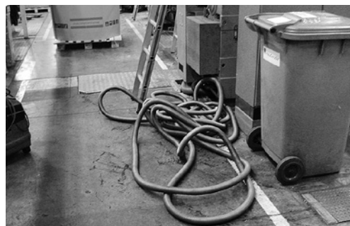
5 Attention, risque de chute!