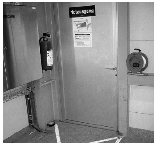
3 Dégager les sorties de secours.