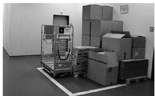
4 Les voies de circulation et les zones d'entreposage sont signalées et délimitées de manière exemplaire.