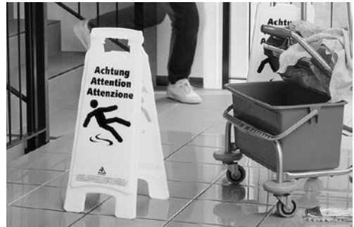
1 Panneau d'avertissement. Cet accessoire permet de signaler les risques de chute temporaires.

Ces accidents ne sont pas une fatalité: il est possible de les éviter, à condition d'appliquer quelques mesures ciblées.