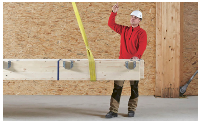
1 La formation des élingueurs doit se dérouler dans le cadre de travail habituel.

Chaque année, des accidents graves se produisent lors de l'élingage et du transport de charges. Seules les personnes formées à cet effet sont autorisées à élinguer des charges avec des grues. L'employeur est responsable de la sélection et de la formation de ces personnes.