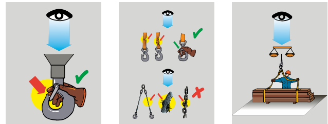
3 Déplacer correctement les charges

Certains centres de formation pour grutiers proposent également des formations à l'élingage de charges. Voir: www.suva.ch/grues