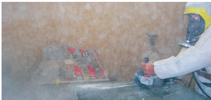
Fresatura di serpentinite senza aspirazione alla fonte