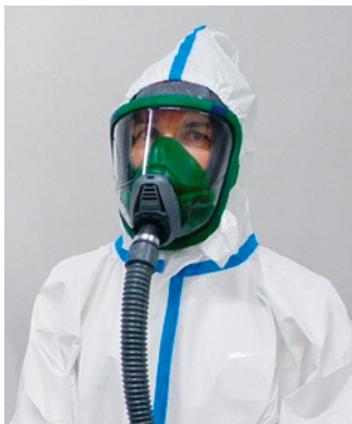
Maschera a ventilazione assistita con cappuccio TMP3