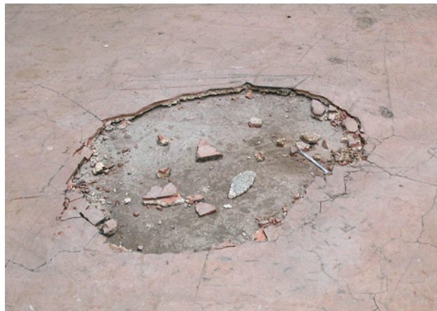
1 Pavimento in materiale composito a base di magnesite contenente amianto

Se si sospetta che la rimozione dei pavimenti in materiale composito possa causare un rilascio di fibre di amianto nell'aria, prima di iniziare i lavori è necessario determinare con precisione questo rischio.