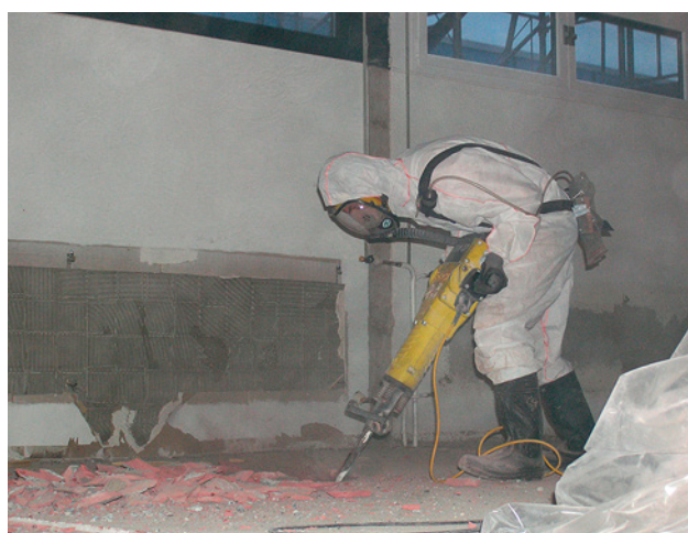
2 Pavimento rimosso con un martello demolitore