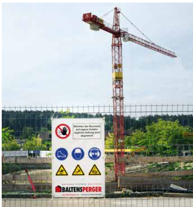
02 // Dove si celano i rischi sul lavoro?

hanno un atteggiamento molto positivo nei confronti delle misure di prevenzione e presentano anche proposte di miglioramento. Ciò permette di ottimizzare continuamente le misure antinfortunistiche» dice Baltensperger. I capi cantiere e i quadri sono inoltre regolarmente informati sulle statistiche inerenti gli infortuni e sulle novità. Oltre alla sicurezza sul lavoro sono importanti anche il benessere personale e la salute dei dipendenti. A tale scopo la Baltensperger SA mette a disposizione in estate su ogni cantiere un grill per permettere agli operai di alimentarsi in modo variato e per ristorarsi. Per prevenire i raffreddamenti, la Baltensperger SA regala ogni anno una giacca in fleec. Se un dipendente è vittima di un infortunio è importante sotto l'aspetto economico e personale farlo ritornare al più presto al suo posto di lavoro. Per tale motivo la Baltensperger SA mette a disposizione dei posti di lavoro che permettono di risparmiarsi per facilitare la reintegrazione.