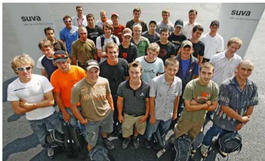
01 // Hanno concluso l'apprendistato come selvicoltori senza subire alcun infortunio. La premiazione ha avuto luogo il 21 agosto 2009 a Lucerna. // Foto: PHOTOPRESS/Urs Flueeler

Per la stagione di raccolta del legname 2009/2010 la Suva ha incaricato degli specialisti qualificati che svolgeranno 500 ulteriori controlli sui posti di lavoro. Gli specialisti osserveranno gli operai forestali durante i lavori di abbattimento e discute-