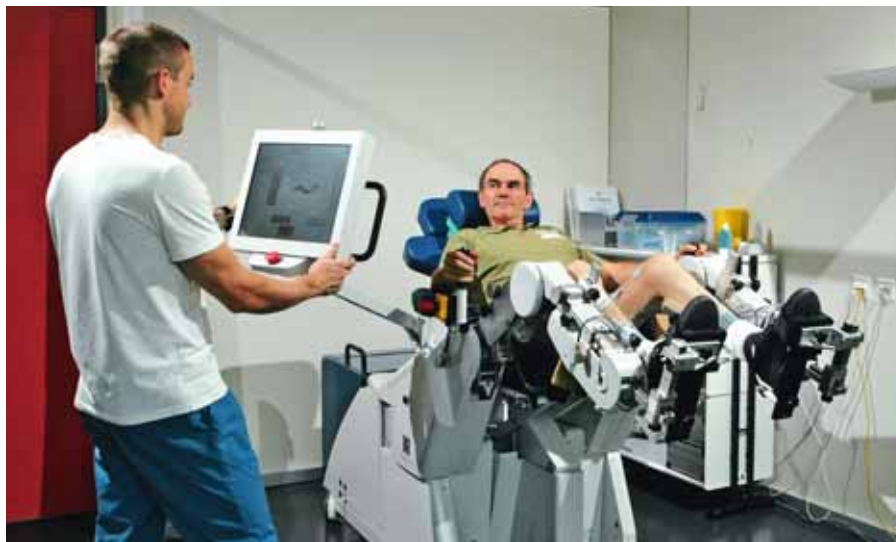
01 // La Clinica romanda di riabilitazione collabora con vari partner nel campo della robotica medica.

Il mercato romando della riabilitazione è in continuo sviluppo. Per poter guardare