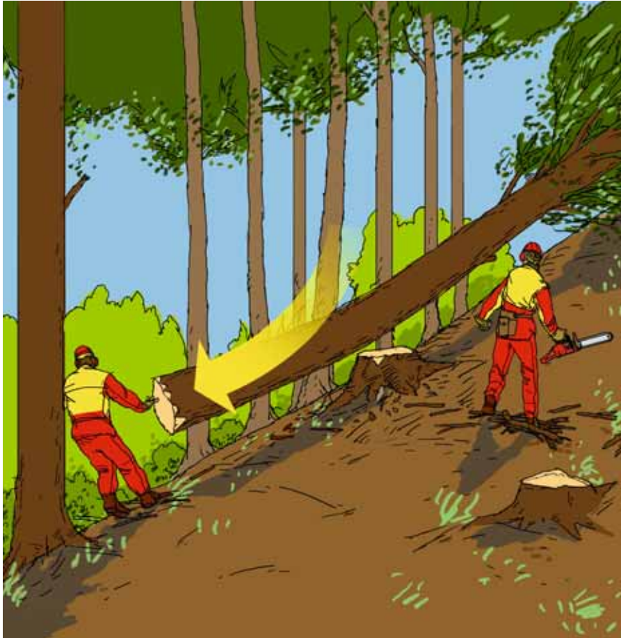
01 // Operaio colpito a morte dalla base del tronco scivolata all'indietro // Foto: Suva

Due operai di un'azienda forestale stavano eseguendo dei lavori di taglio in una zona boschiva molto fitta. Durante il taglio di un abete, all'improvviso la base del tronco è rimbalzata all'indietro. Uno degli operai è stato colpito dal piede del tronco e schiacciato contro un albero vicino.