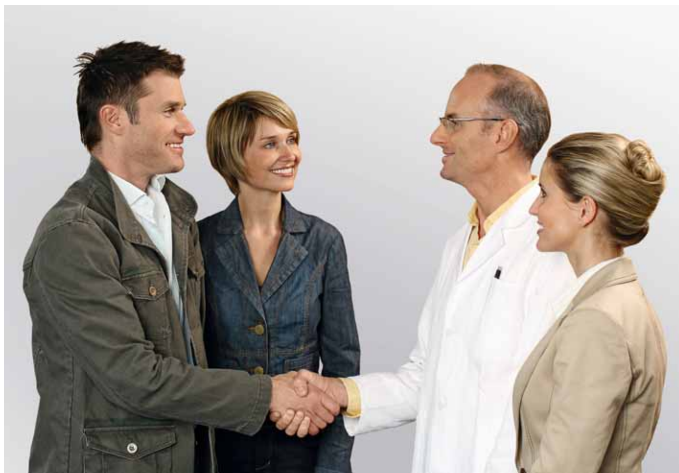
01 // Controllo dei costi: le vittime d'infortunio beneficiano di un'assistenza completa grazie ad un'ottimale gestione dei casi.

Nel 2010 i premi delle casse malati subiranno in media un aumento dell'8,7 per cento. Il dibattito sui problemi che gravano sul sistema sanitario non risparmia nessuno, neppure la classe politica, alla disperata ricerca di una soluzione. La Suva, grazie a vantaggi pratici e di sistema, ha sotto controllo i costi e non deve aumentare i premi in media nel 2010. Questo dimostra che nel sistema sanitario ci sono anche altre strade percorribili.