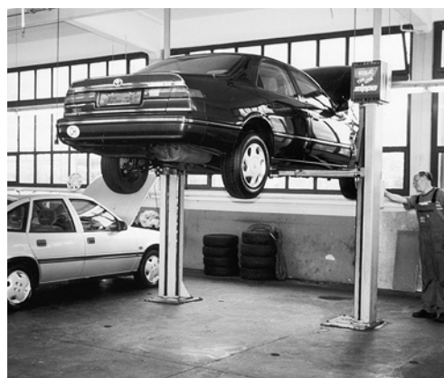
2 In questa zona l'operatore ha una perfetta visibilità e non c'è pericolo di schiacciamento.