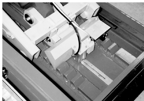
3 Nottolino contro la discesa accidentale.