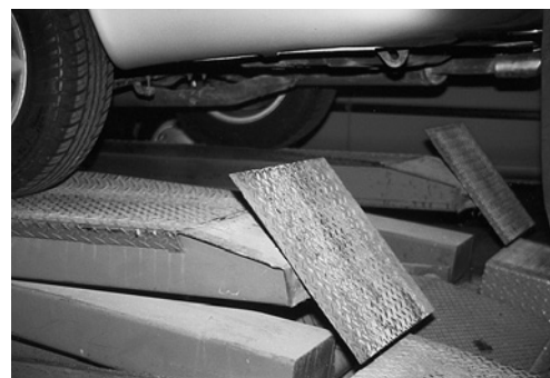
4 Dispositivo di arresto con attivazione automatica ad ogni movimento verso l'alto del sollevatore.