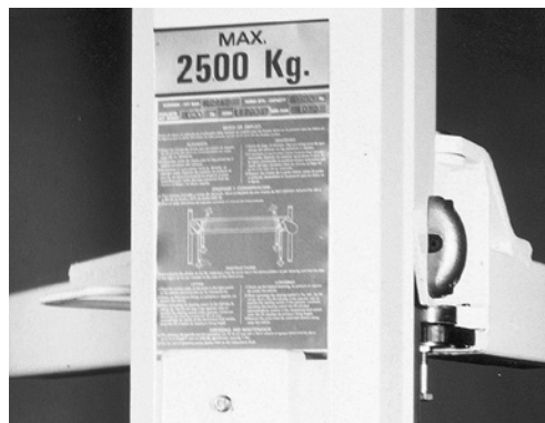
1 La portata deve essere indicata chiaramente.