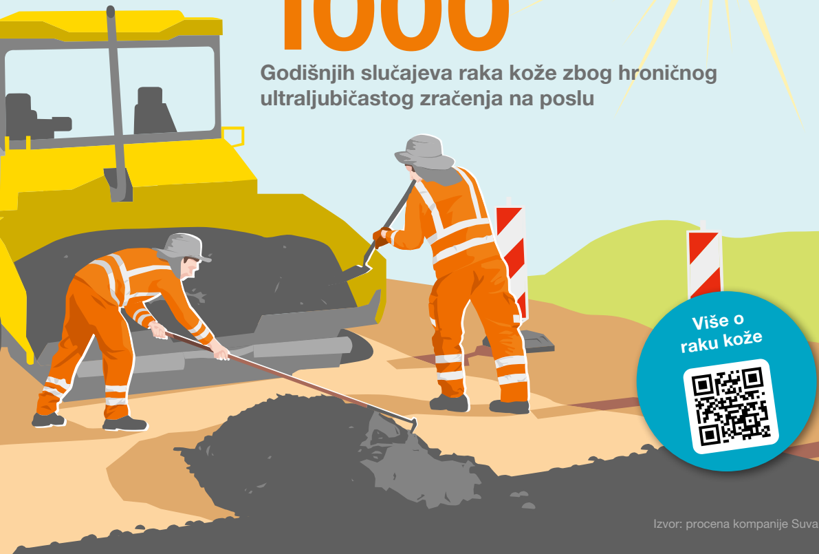
Nemelanomski rak kože

Godišnjih slučajeva raka kože zbog hroničnog ultraljubičastog zračenja na poslu