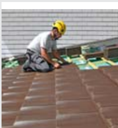
Neuf règles vitales pour les travaux en toitures et façades