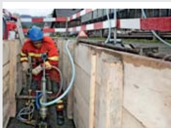
Conduites de gaz naturel en service: consignes de sécurité