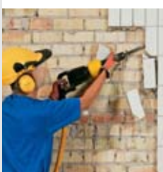
Vibrations transmises au système main-bras Connaissez-vous les risques?