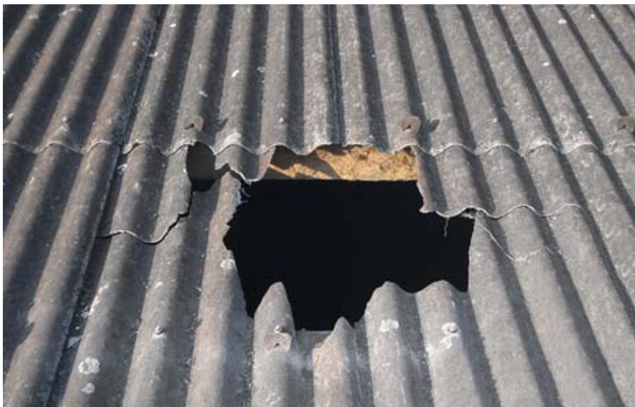
01 // Un travailleur temporaire est tombé à travers une toiture en fibrociment. Il a été grièvement blessé. // Suva