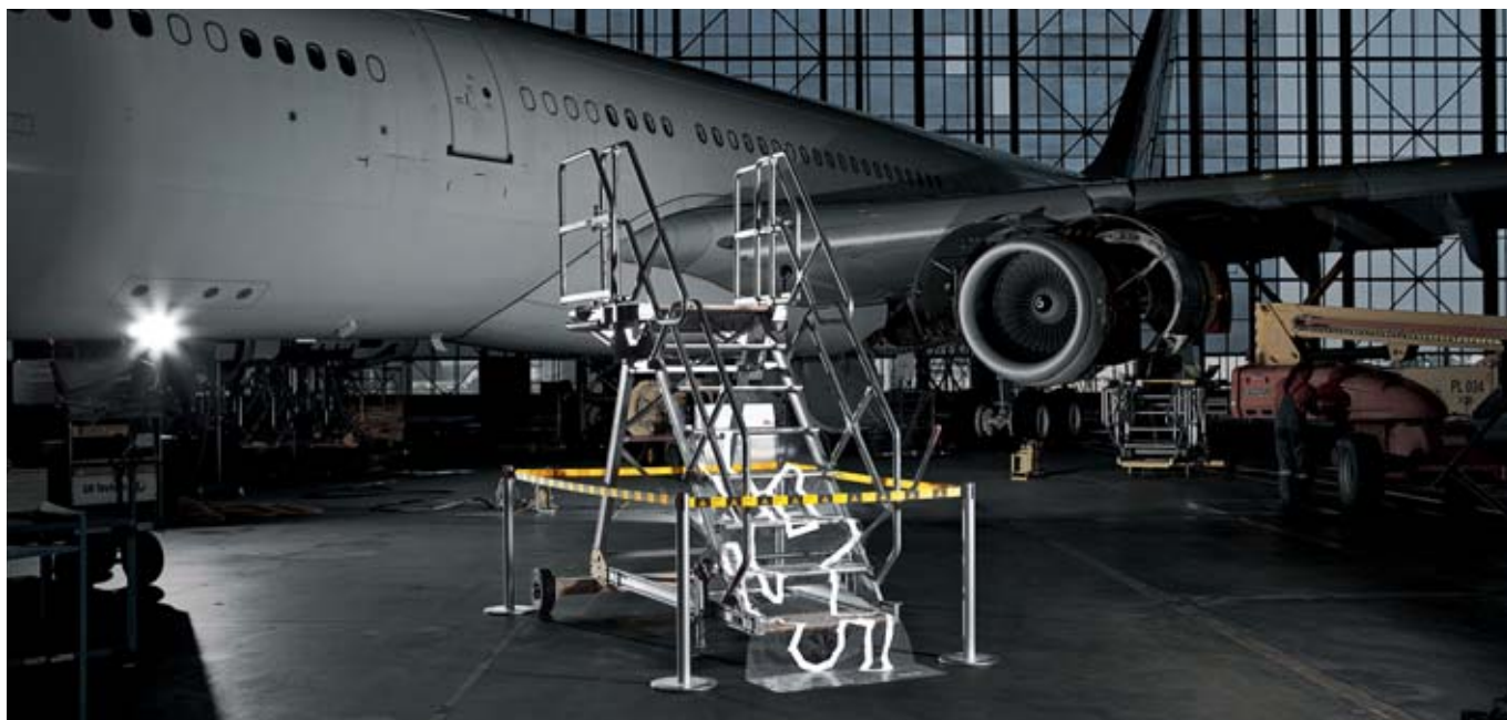
01 // La scène d'accident montre ce qui peut se produire lorsqu'on n'utilise pas la main courante dans les escaliers.