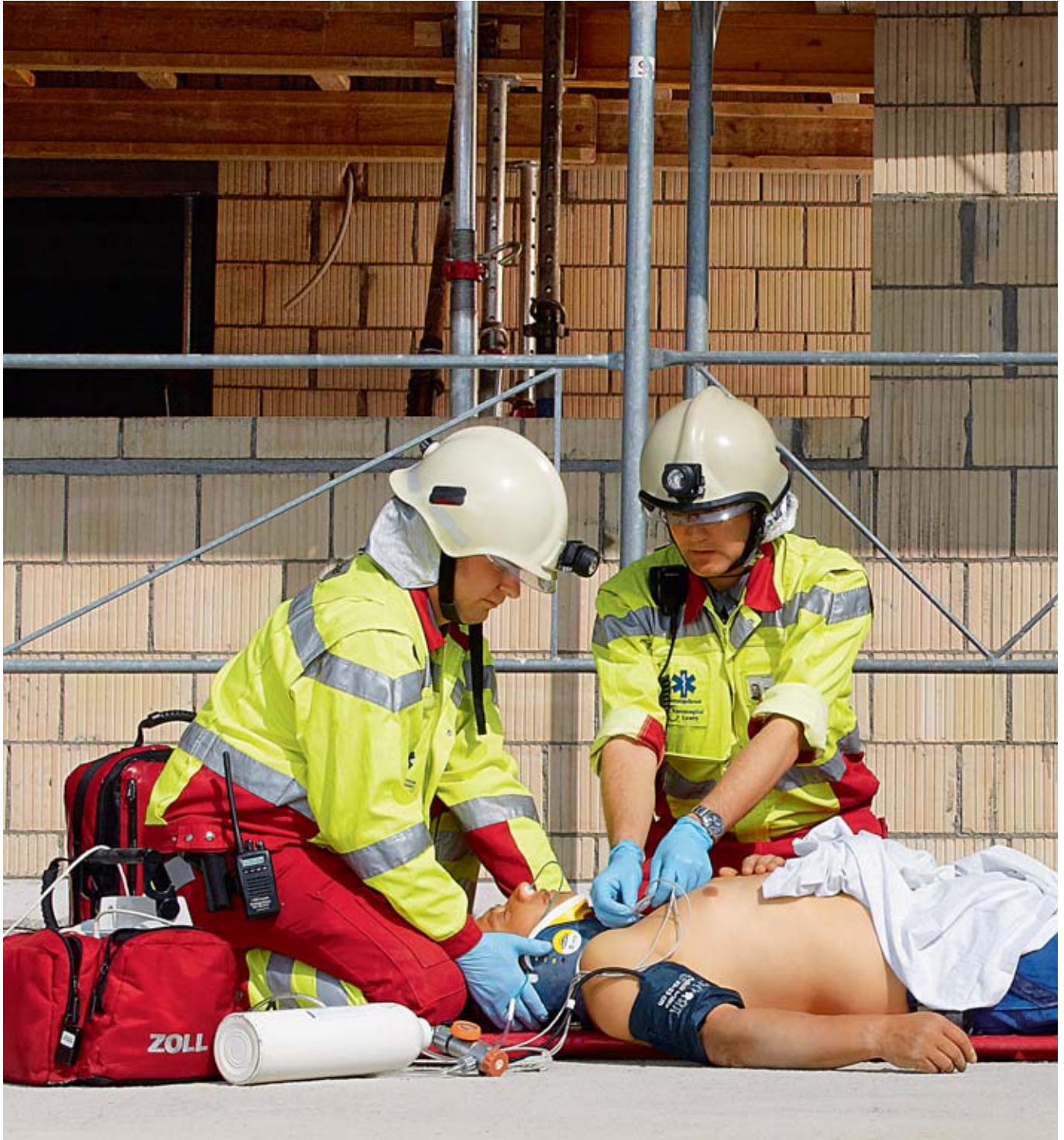
01 // La Suva enregistre une augmentation du nombre d'accidents en 2011.

Les résultats de l'analyse de l'année d'assurance 2011 sont sans ambiguïté: malgré l'augmentation du nombre d'accidents, celui des nouvelles rentes allouées n'a cessé de baisser. L'engagement de la Suva en faveur de la réinsertion professionnelle des victimes d'accident porte donc ses fruits.