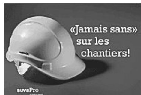
Les règles de sécurité suisses et locales doivent être appliquées. En cas de différence entre celles-ci, on se soumettra à la règle la plus protectrice pour le collaborateur.