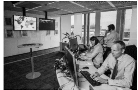
Plateau d'assistance médicale et sécuritaire.