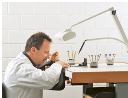
1 L'éclairage d'un poste de travail doit pouvoir être adapté aux activités spécifiques (par ex. travail de précision).