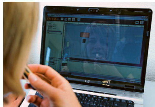
4 Reflets sur un écran d'ordinateur