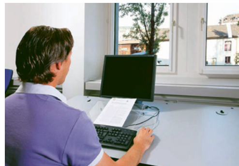
5 Les fenêtres situées derrière les écrans d'ordinateur ou dans le dos des travailleurs sont source de contrastes importants.