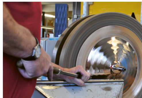
3 Reflets sur une pièce en cours d'usinage

Un poste de travail permanent correspond au secteur dans lequel un travailleur – ou plusieurs successivement – se tient pendant plus de deux jours et demi par semaine.