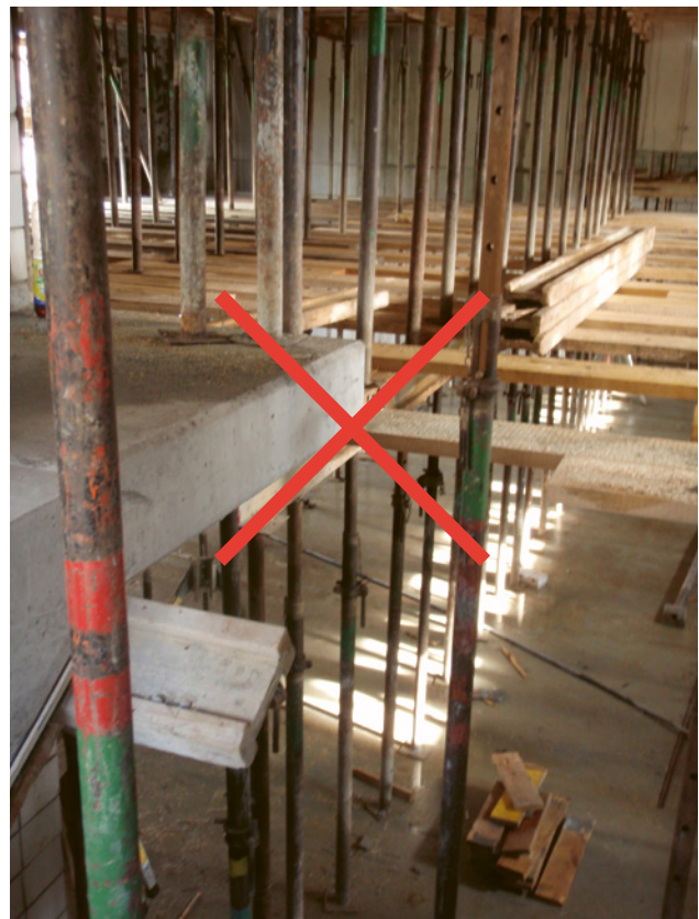
1 Solche Zwischenböden sind verboten. Die Arbeiten müssen eingestellt werden.

Schalungs-Zwischenböden stürzen ein und führen zu schweren Unfällen und/oder hohen Sachschäden!