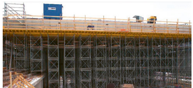
3 Zeitgemässes Schalungssystem für grosse Raumhöhen.