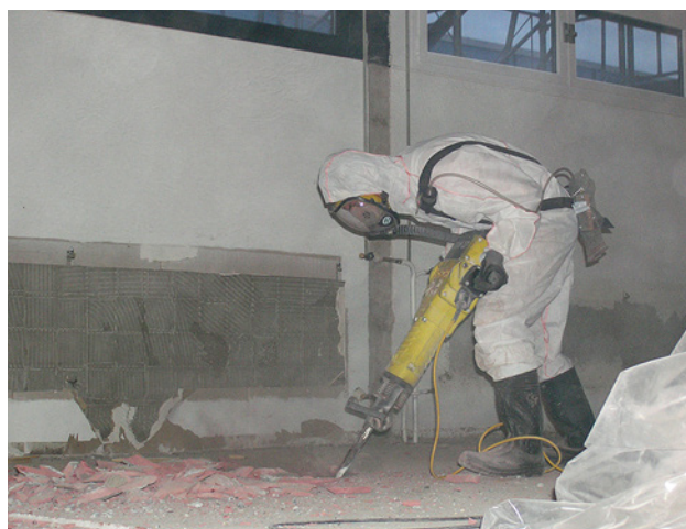
2 Ein Bodenbelag wird mit einem Spitzhammer entfernt.