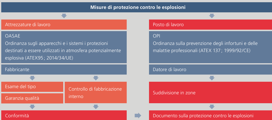
Principi di protezione contro le esplosioni applicati alle attrezzature e al posto di lavoro.