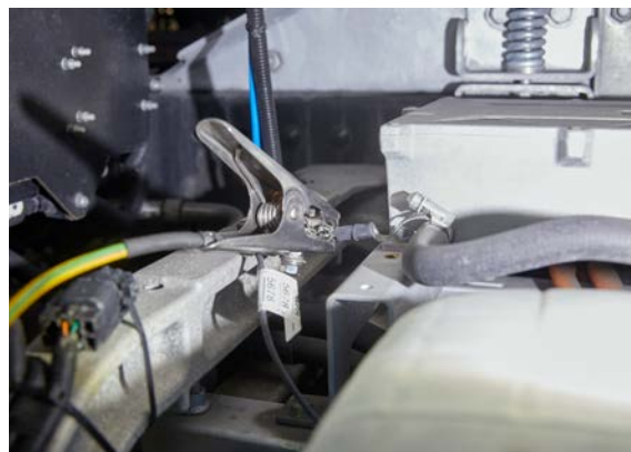
Un idoneo collegamento equipotenziale previene il pericolo di scariche elettrostatiche.

A causa della differenza di potenziale del veicolo rispetto all'ambiente circostante, sussiste in linea di massima un pericolo di scariche elettrostatiche. Di conseguenza, in officina occorre prevedere un idoneo collegamento equipotenziale tra veicolo ed edificio. Per prevenire la possibile formazione di scintille quando si lavora sull'impianto a gas, è obbligatorio allacciare il collegamento equipotenziale al veicolo, se l'impianto non è stato inertizzato. È possibile sostituire componenti e parti di carrozzeria esterni all'impianto del gas senza messa a terra.