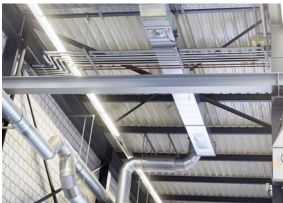
La ventilazione artificiale consente di assicurare un ricambio d'aria adeguato.

Ventilazione artificiale (ventilazione di base): sono considerati sufficientemente ventilati in modo artificiale i locali in cui la potenza di ventilazione è in grado di assicurare un ricambio d'aria pari a 3 volte per ogni ora. Il punto di aspirazione del ventilatore deve essere posizionato in funzione delle caratteristiche fisiche del carburante gassoso, ma in ogni caso a un'altezza massima di 10 cm dal pavimento o in prossimità del soffitto. Per attenersi alle quantità di aria richieste ed evitare l'insorgere di pressioni negative indesiderate, è necessario garantire un flusso costante di aria fresca (a seconda della situazione, anche con un apporto attivo mediante ventilatori). L'aria aspirata va evacuata in modo sicuro all'esterno e l'estremità del condotto di ventilazione deve essere protetta dalla penetrazione di acqua e sporcizia.