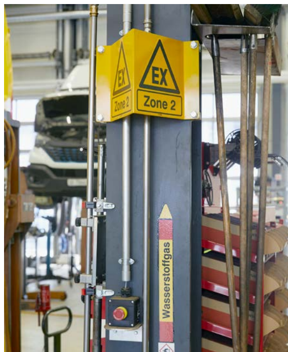
Le zone a rischio di esplosione devono essere riportate in un piano delle zone.

Se si prevede la formazione di atmosfere esplosive, è necessario elaborare un documento sulla protezione contro le esplosioni che contenga le relative misure (opuscolo Suva 2153.i «Prevenzione e protezione contro le esplosioni – Principi generali, Prescrizioni minime, Zone»). La procedura da osservare è illustrata nei due schemi di seguito riportati.