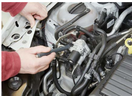
Il livello di sicurezza S2 prevede la trattazione di tutti i lavori che riguardano l'impianto a gas.

Questo livello può soddisfare i requisiti necessari per l'autorizzazione a eseguire le prove sui serbatoi di gas prescritte dagli uffici della circolazione stradale.