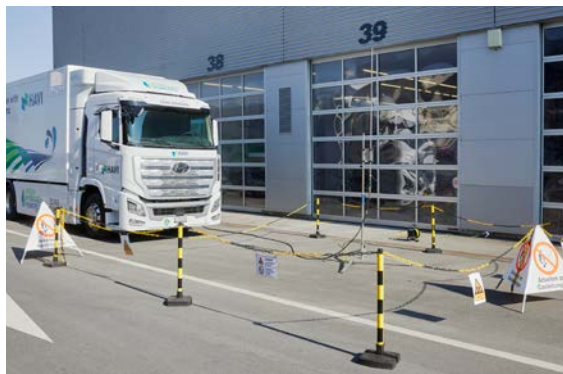
Durante lo sfiato di gas occorre bloccare l'accesso alla zona di sicurezza.

Il processo di scarico del gas mediante sfiato può avvenire solo attraverso l'apposito dispositivo di sfiato dell'edificio o un dispositivo mobile all'aperto. Il gas deve poter essere volatilizzato senza pericolo (prevenzione di accumuli). Per il GNL e il GPL occorre osservare misure supplementari (cfr. cap. 4.2.2 e 4.2.3) nonché attenersi alle indicazioni del fabbricante del dispositivo di sfiato. Lo scarico dell'impianto di gas deve avvenire in un'area appositamente contrassegnata (zona di sicurezza). Durante il processo di scarico, la zona di rilascio deve essere libera da persone e veicoli. Il gas viene convogliato con un tubo fuori dal veicolo nella zona di sfiato, dove non è possibile eseguire altri lavori durante l'evacuazione. Occorre bloccare l'accesso alla zona di sicurezza nonché contrassegnarne chiaramente gli accessi con il segnale di avvertimento per atmosfera esplosiva. In linea di massima, durante i temporali è vietato procedere allo sfiato di gas.