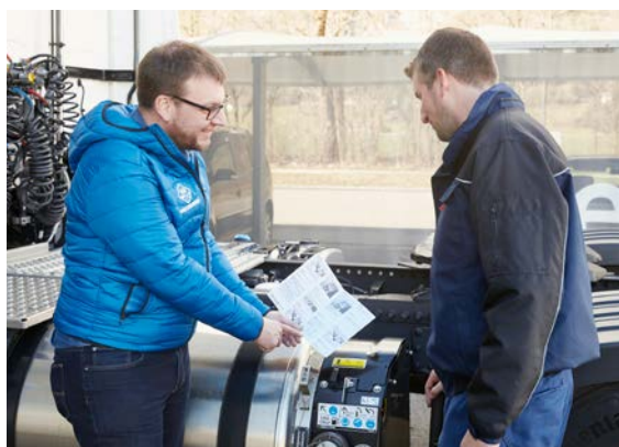
Il livello di sicurezza S0 prevede la trasmissione di conoscenze di base.