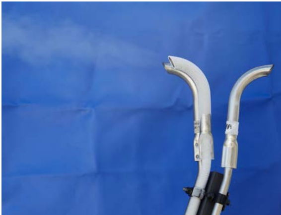
In caso di soste prolungate, nei serbatoi a GNL può essere necessario procedere a uno sfiato di gas.

Il contatto con tubi e componenti di conduzione del gas comporta un pericolo di ustioni criogeniche / congelamenti.