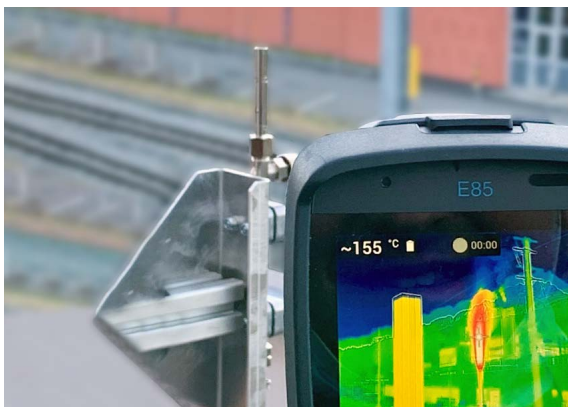
L'idrogeno è incolore, inodore e produce una fiamma invisibile.

L'energia di 1 kg di idrogeno gassoso corrisponde a quella di circa 3 kg di benzina. Poiché l'idrogeno gassoso ha una densità energetica minima in termini di volume, viene prevalentemente immagazzinato nei veicoli come gas compresso.