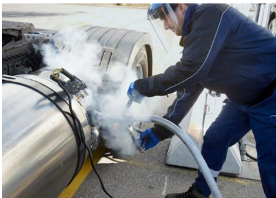
Anche per il rifornimento occorre eseguire l'individuazione dei pericoli.

I datori di lavoro sono tenuti per legge a individuare i pericoli connessi a interventi su veicoli a gas come pure ad attuare le misure necessarie da ciò derivanti.