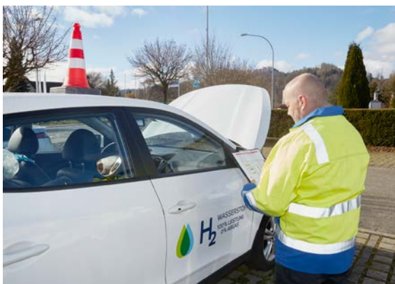
In caso di guasto, i veicoli a gas devono essere contrassegnati con un cono segnaletico sul tetto.