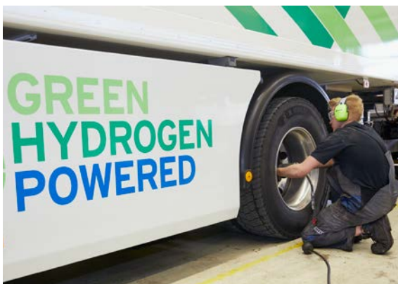
Il livello di sicurezza S 1 è previsto per tutti i lavori che non richiedono un intervento diretto sull'impianto a gas.

lavori ordinari di manutenzione e riparazione, lavori di carrozzeria, soccorso stradale, soccorso in caso di incidente ecc.