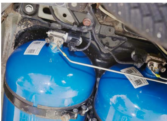
La pressione di stoccaggio del GNC è di 200 bar.

Il GNC è composto principalmente da metano compresso, il quale viene estratto dalle profondità del suolo o ottenuto per biodegradazione di materiale organico (biogas), successivamente sottoposto a pulizia e trattamento. In Svizzera, il GNC che può essere acquistato presso le stazioni di servizio è composto per circa un terzo da biogas. In ogni caso, che sia biometano, metano sintetico o gas naturale, si tratta sempre dell'idrocarburo metano.