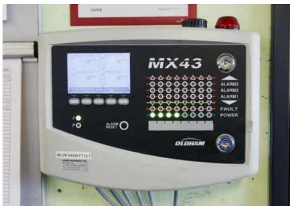
Gli impianti di rilevazione gas rilevano le concentrazioni di gas esplosive.