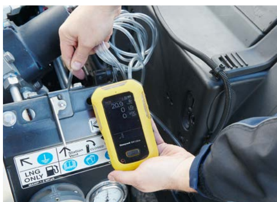
I rilevatori di gas portatili sono utili nella ricerca di perdite di gas.

Di solito i rilevatori di gas portatili vengono indossati dal personale e servono a monitorare l'ambiente immediatamente circostante. Anche in questo caso le misure dipendono dal valore misurato e dal tipo di gas. Gli utenti di rilevatori di gas portatili devono essere formati sull'uso degli apparecchi e sull'interpretazione dei relativi segnali e visualizzazioni.