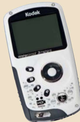
1. Preis: Kodak-Playsport-Videokamera im Wert von 200 Franken