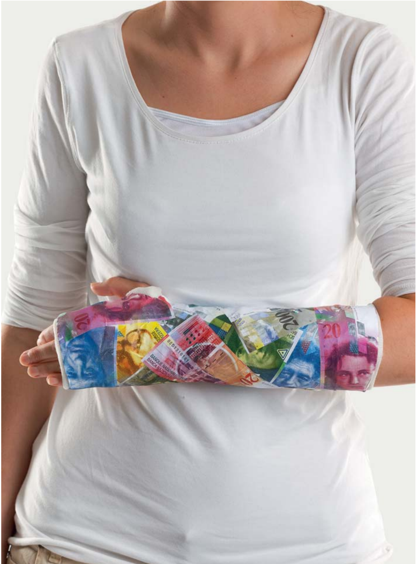
Der Suva gelingt es zum siebten Mal in Folge, ihre Prämien ab Januar 2014 für viele Branchen zu senken.