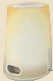
2. Preis: Lichtwecker