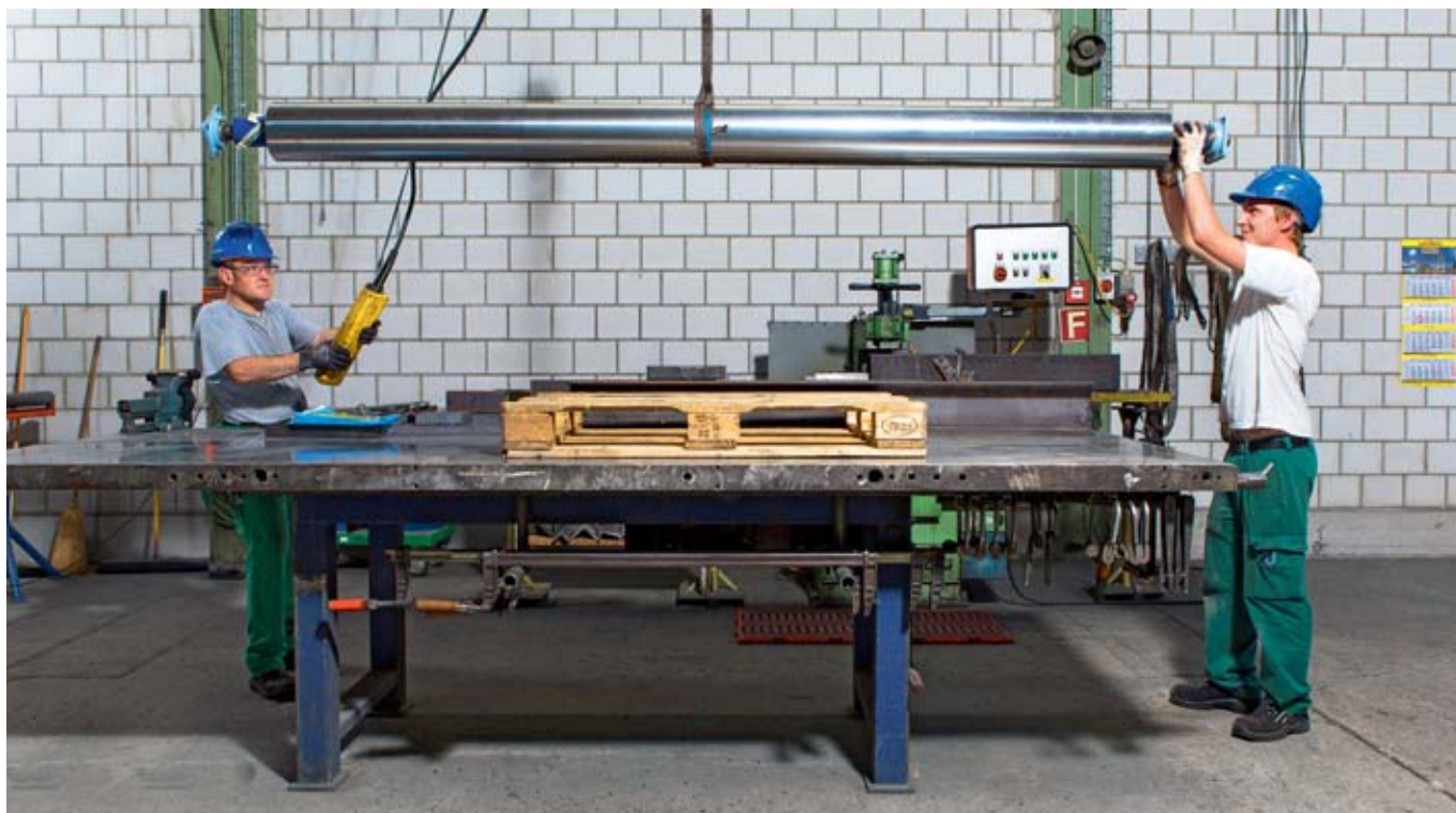
Die Habasit AG hat die Sicherheits-Charta unterzeichnet, weil sie ihr Sicherheitsverständnis auf den Punkt bringt.

In der Baubranche ist sie bereits etabliert: Nun wird die Sicherheits-Charta der Suva auf weitere Branchen ausgeweitet. Die Habasit AG in Reinach BL unterzeichnete sie als einer der ersten Industriebetriebe. Für Habasit steht die Charta für eine Sicherheitskultur, die das Unternehmen schon seit langer Zeit lebt.