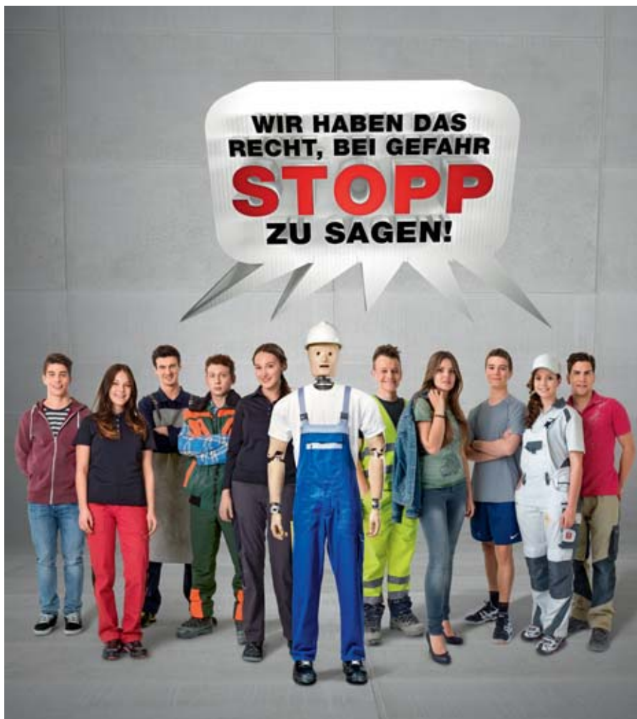
Arbeitssicherheit und Gesundheitsschutz sollen vom ersten Arbeitstag an für Lernende ein Thema sein.

Um das zu erreichen, will die Suva mit der Sensibilisierung für Arbeitssicherheit und Gesundheitsschutz so früh wie möglich anfangen – ab dem ersten Arbeitstag. // iso