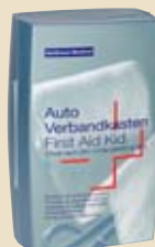
4.–10. Preis: Erste-Hilfe-Verbandkasten