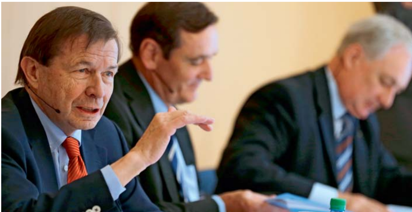
Franz Steinegger im Element: An der Bilanzmedienkonferenz legt er Rechenschaft über das Geschäftsjahr 2012 ab.

Franz Steinegger legt auf Ende 2013 sein Amt als Verwaltungsratspräsident der Suva nieder. Dies gab er anlässlich der diesjährigen Bilanzmedienkonferenz in Luzern bekannt. Er übergibt ein kerngesundes Unternehmen, das im Geschäftsjahr 2012 einen Überschuss von 247 Mio. Franken erwirtschaftete.