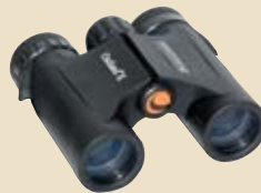
3. Preis: Fernglas